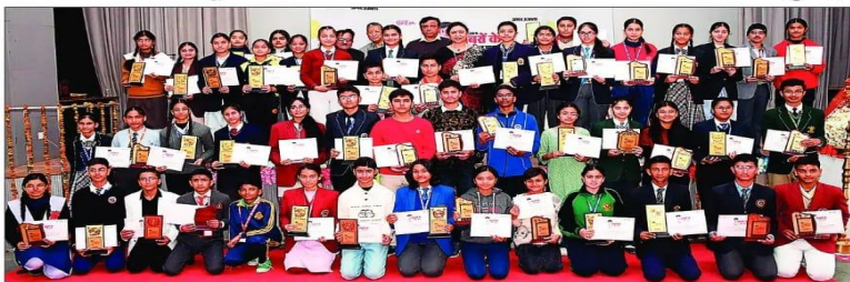
हल्द्वानी के एमबीवीजी कॉलेज सभागार में शनिवार को न्यूज रीडिंग प्रतियोगिता के प्रथम विजेताओं को सम्मानित किया गया।